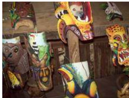
Mascaras de Boruca. Grupo AMAB

Como parte del área estratégica de Economía Indígena el CICA, ha planteado fortalecer las economías en los territorios indígenas a través de la formulación de planes comunitarios desde la visión indígena, así como de las empresas o grupos indígenas organizados en el marco de actividades económicas tales como artesanía, turismo y productos de la naturaleza.