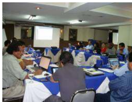
Taller CICA, conceptualización de K'ATs

Como primer avance en el proceso, el CICA facilito el taller de conceptualización y definición de redes indígenas para el Buen Vivir, el cual permitió definir el abordaje conceptual y estratégico de CICA en la facilitación y creación de Redes Indígenas, específicamente se conceptualizó los principales temas como economía indígena, empresariado Indígena, las redes indígenas que a partir de la discusión y el análisis en el Taller se le conoce como K'at 1 , así como la priorización de las tres actividades de la economía indígena que estarán integrando las K'ats para su conformación y fortalecimiento, tales como Turismo en Comunidades Indígenas 2 , Artesanías de los Pueblos