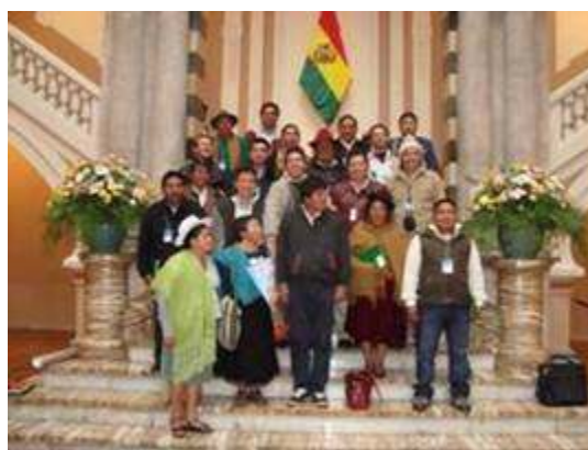
Encuentro con el Presidente Evo Morales

Estos resultados muestran un proceso de maduración, nuevos desafíos y un nuevo amanecer para las luchas en el continente, quienes avanzan con paso firme hacia la construcción de un mundo solidario y digno, respetuoso de la vida, la naturaleza y la diversidad, construyendo las alianzas y unificando las agendas y las luchas.